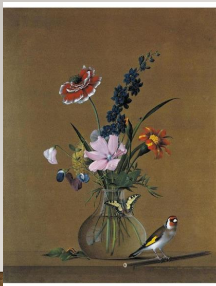
Федор Петрович Толстой «Букет цветов, бабочка и птичка»

Натюрморт – это композиция, составленная из природных предметов и вещей сделанных руками человека.