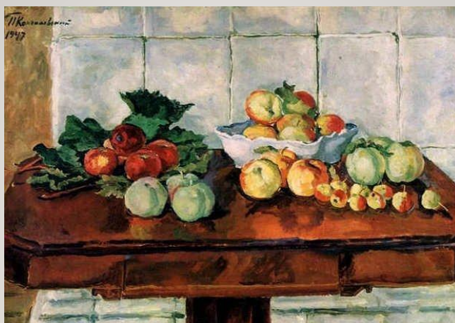
Петр Петрович Кончалоский «Яблоки на столе у печи»