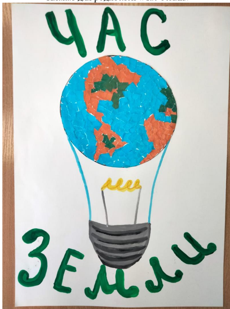
Плакат для родителей «Час Земли»